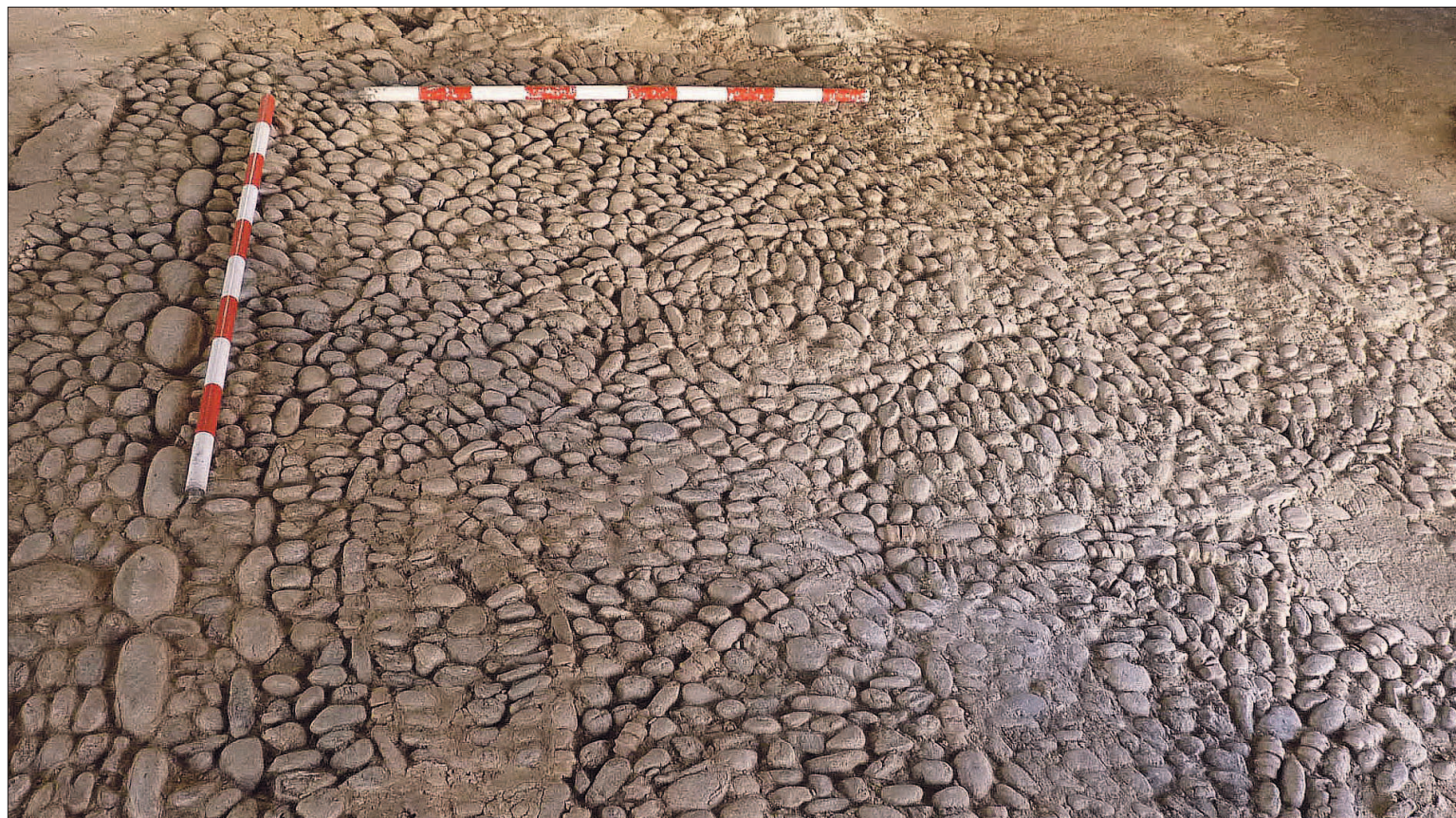
Detalle decoración de metatarsos de bóvido y cantos de río. I. Marqués.

El suelo está formado por cantos de río de distintos tamaños, según el motivo decorativo, combinados con metatarsos de bóvido, describiendo un diseño que se iría repitiendo en la extensión de la superficie a cubrir. Ambos materiales están inscritos en la tierra, sin ningún tipo de mortero o argamasa que los una, con una disposición continua formando una sola unidad en su configuración