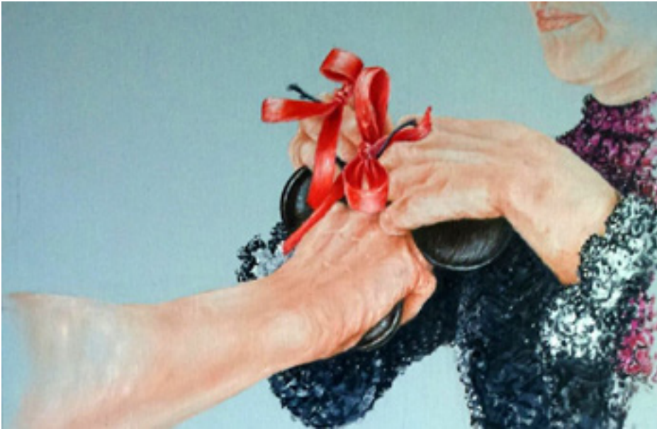
Arriba: Detalle. Anudando las castañuelas a un danzante de San Pedro de Gáillos. Portada conmemorativa de los 50 números alcanzado por la Revista Lazos en febrero del 2016, editada por el Centro de Interpretación del Folklore/Museo del Paloteo, de San Pedro de Gáillos.