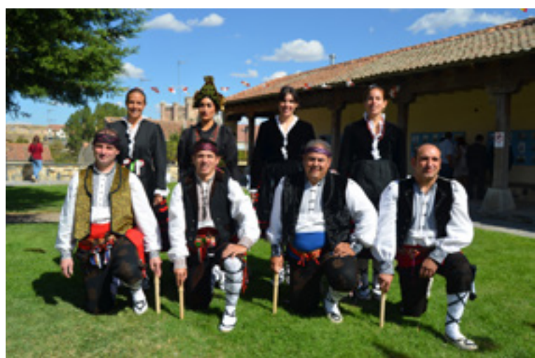
Arriba: Recuperación del traje de Zarragón en Veganzones. IV Centenario "Villa de sí y de por sí" (1615-2015). Mar. 2015. Abajo: Reactivación de las danzas de palos en Turégano. 50 Aniversario del incendio del Barrio de Bobadilla.