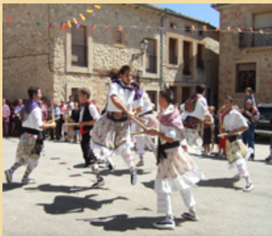
Fotografía de portada: Danzantes de San Pedro de Gaiños (Segovia). I Becas de Investigación del IGH, 2013. Foto: Esther Maganto, 2013.