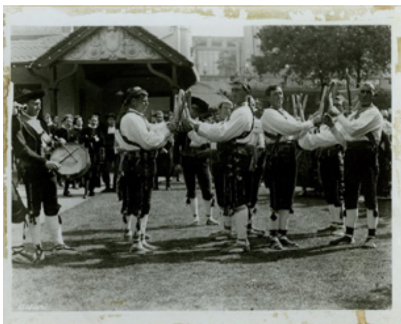
Danzantes de Abades, Londres (1914). Museo del Romanticismo: CE36545.

Durante el reinado de Alfonso XIII, tal y como argumenta Javier Rivera Blanco (Universidad de Alcalá) se consideró de vital importancia fomentar el turismo español, en pro de dar a conocer España a otros países del entorno europeo. Para ello, el monarca español creó en 1911 la Comisaría Regia del Turismo y la Cultura Popular, nombrando como Comisario a Benigno de la Vega Inclán y Claquer, “encargado de estudiar, proponer y plantear los medios conducentes al fomento del turismo y a la divulgación de la cultura artística popular”.