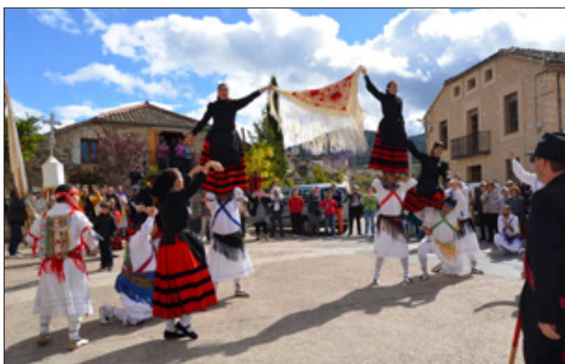
La Danza de La Puente en Torre Val de San Pedro: hacia 1920 y en 2014. Presencia de la "Danza de Gitanas" en 1681 y de las "Danzantas" en 1832.

La correcta gestión municipal resulta por tanto clave, puesto que tal y como apunta Díaz Viana, "en el contexto de las culturas populares se recurre a distintas estrategias: entre otras el relanzamiento y promoción turística de localidades", donde el mayor problema surge de la "necesidad de reubicarse en el panorama de la globalidad" y de "identificarse con los dos grandes paradigmas: el de la tradición o la vanguardia". Al mismo tiempo afirma, que "herencia -o patrimonio cultural- y turismo son industrias colaboradoras: la herencia convierte las localizaciones en destinos y el turismo las hace económicamente viables como exhibiciones de ellas mismas".