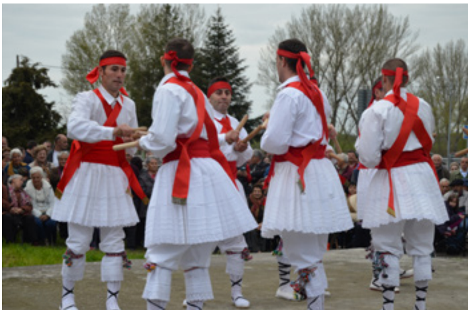
Danzantes de Gallegos de la Sierra (Segovia). Presentación del libro Los danzantes de enagüillas en la provincia de Segovia (E. Maganto) y Encuentro de Danzantes (Arcones, Gallegos, Torre Val de San Pedro y San Pedro de Gaillos). Ayto y A. C. La Cachucha. Mayo, 2016.

En Segovia, la Diputación Provincial y a través del Instituto de la Cultura Tradicional Segoviana "Manuel González Herrero" -creado en 2012-, ha concedido dos Becas de Investigación y ha publicado dos libros sobre esta temática: tras una de las I Becas de Investigación de 2013, publicada en forma de libro en el 2015 bajo el título Los danzantes de enagüillas en la provincia de Segovia. Mapa geográfico-festivo a comienzos del siglo XXI (de E. Maganto), en 2016 se ha concedido una de las IV Becas de Investigación al proyecto firmado por F. Álvarez Collado, Danza y Rito en la provincia de Segovia , continuación y amplia-