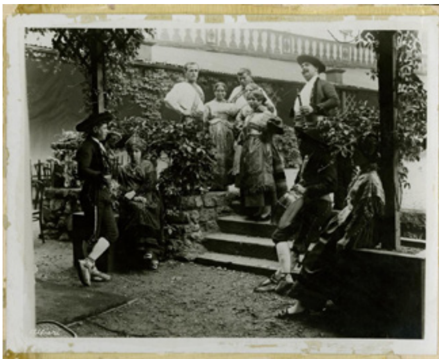
Comparsa segoviana con el Tío Tocino. Londres (1914). Foto: Alfieri. Museo del Romanticismo: CE36537.

Durante el mes de junio de 1914, siguen llegando noticias del éxito de público conseguido por las diferentes agrupaciones que actúan en el Pabellón Español, donde se exhiben cintas cinematográficas sobre los monumentos de nuestro país, y que se ha decorado con grandes tapices, retratos de la realeza, y entre otros objetos en los que figura también la artesanía, las fotografías enviadas por el Clup Alpino de Segovia -con imágenes de la sierra y panoramas de poblaciones como Segovia y La Granja, posibles destinos turísticos para el público asistente-. Cada mañana, y desde los conventos dirigidos por monjas españolas donde se hospedan los grupos, distintos automóviles los transportan hasta la Exposición, donde se les recoge por la noche.