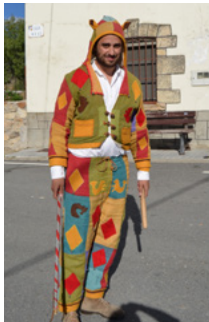
El Zorra de Gallegos de la Sierra. Traje de lino, de dos piezas y confeccionado a mano. Caperuza con orejas y látigo. Foto: E. Maganto, Gallegos. 2013.

Aunque las piezas testigo nos muestran prendas confeccionadas con lino, o con lanas teñidas de diversos colores como en Veganzones o en Prádena de la Sierra, o incluso con combinaciones de sedas tricolores, como la utilizada en Gallegos hasta la década de 1970, el antecedente gráfico que nos remonta a un conjunto hecho a base de retazos de telas en la segunda década del siglo XX nos traslada a Caballar, y al recibimiento que en el año 1912 los danzantes de esta localidad hicieron junto con las Alcaldesas de Zamarramala a los asistentes a un Congreso Internacional de Turismo celebrado en Segovia capital. No obstante, la búsqueda del origen de la función social de este personaje grotesco, y de este atavío, nos conduce hasta la Commedia dell'Arte y su difusión por Europa a lo largo del siglo XVI y XVII: según mis investigaciones, el papel del Zorra en las danzas de palos guarda importantes vínculos con los "Zanni", personajes estereotipados protagonistas de los Lazzi , breves escenas cómicas, grotescas y burles-