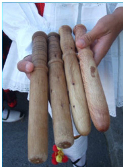
Palos usados en la fiesta de El Rosario. Gallegos de la Sierra. Foto: E. Maganto, 2013.

El presente Monográfico presenta tales contenidos bajo una única firma, la Responsable de esta revista -E. Maganto-, así como la trayectoria del Museo del Paloteo -sito en San Pedro de Gaiillos y centro señero en España-, y la riqueza de nuevos datos aportados desde los archivos, la fotografía etnográfica, la literatura, la pintura y la investigación.